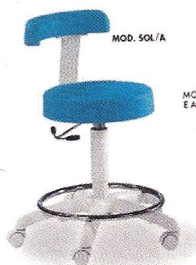
MOD. SOL/A CON COMANDO A LEVA E APPOGGIAPEDI